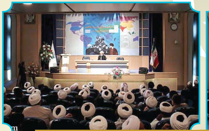
همایش «مبانی مدارای دینی و مذهبی و الگوی امام موسی صدر»