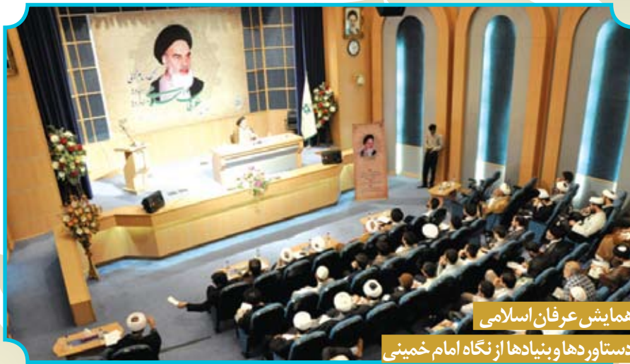
همایش عرفان اسلامی دستاوردها و بنیادها از نگاه امام خمینی