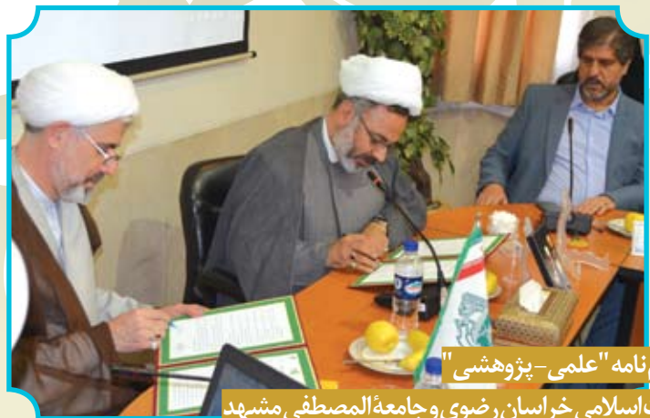
انعقاد تفاهیم نامه "علمی- پژوهشی" دفتر تبلیغات اسلامی خراسان رضوی و جامعه المصطفی مشهد