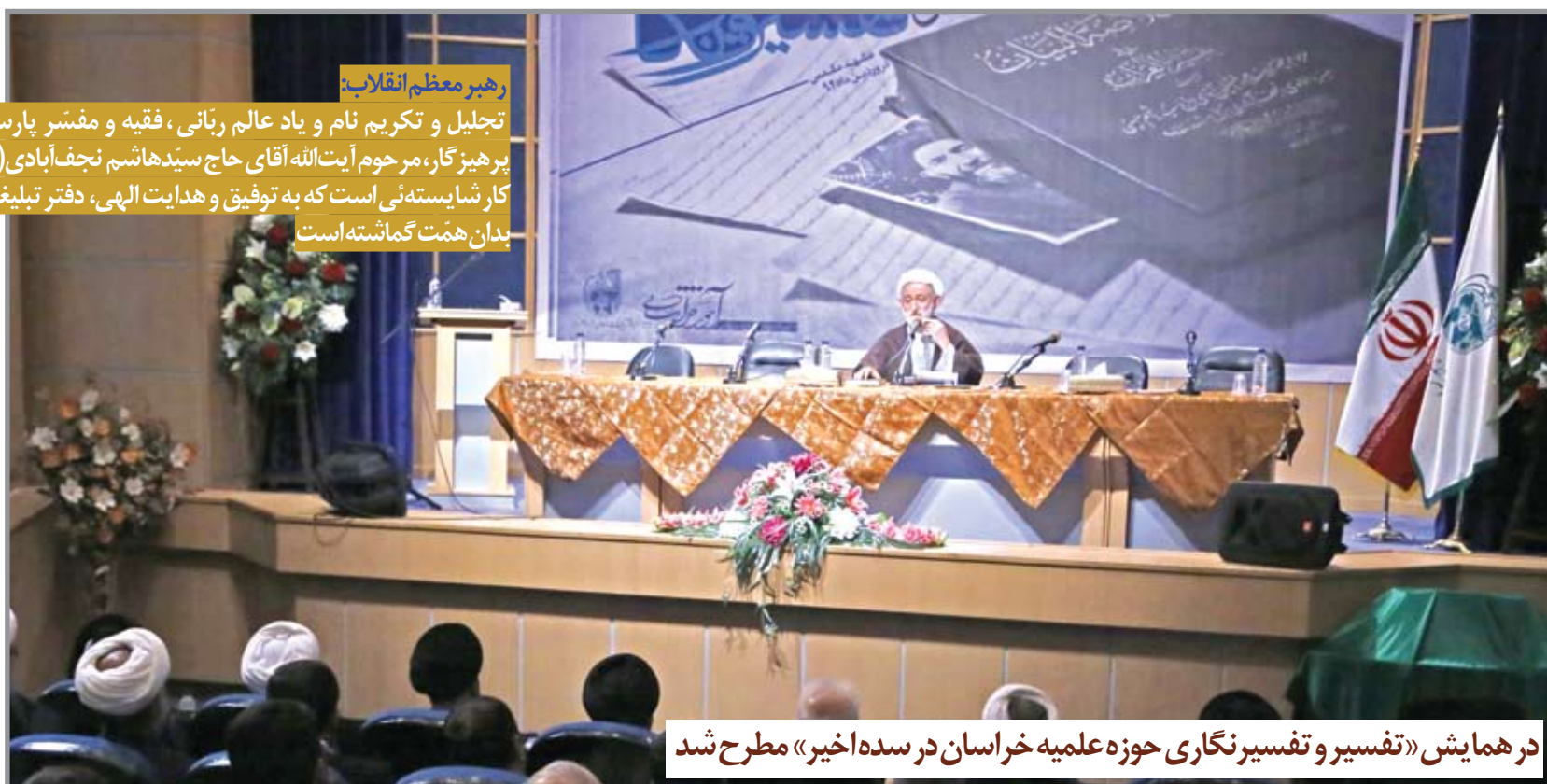
در همایش «تفسیر و تفسیرنگاری حوزه علمیه خراسان در سده اخیر» مطرح شد

تجلیل و تکریم نام و یاد عالم ربانی، فقیه و مفسر پارسا و پرهیزگار، مرحوم آیت الله آقای حاج سیدهاشم نجف آبادی (ره) کار شایسته‌ئی است که به توفیق و هدایت الهی، دفتر تبلیغات بدان همت گماشته است