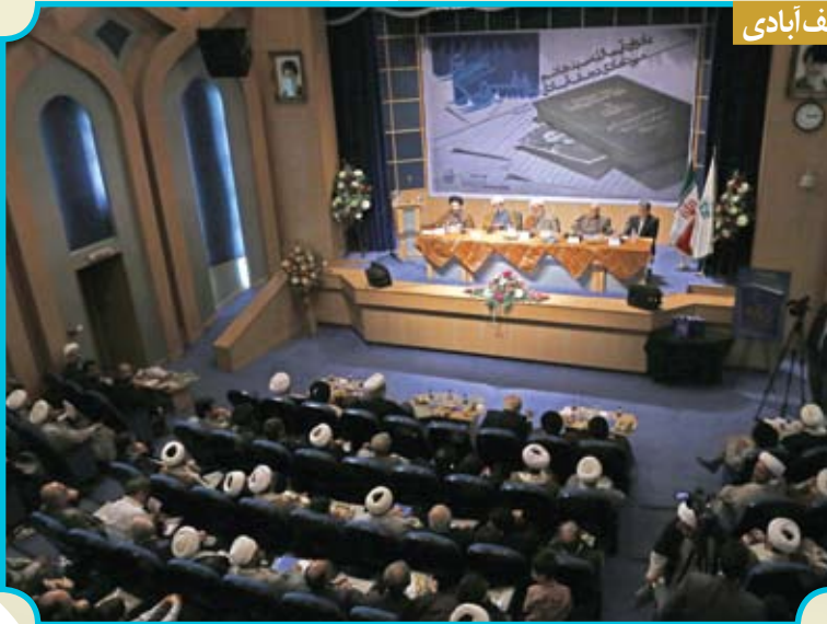
همایش تفسیر و تفسیر نگاری یادواره آیت الله سید هاشم نجف آبادی