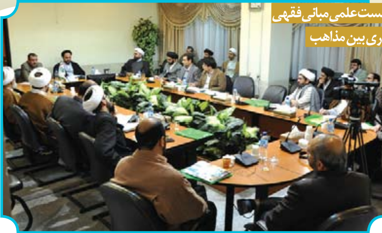
نشست علمی مبانی فقهی مداری بین مذاهب