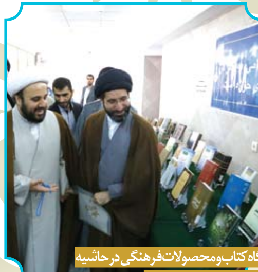
نمایشگاه کتاب و محصولات فرهنگی در حاشیه همایش تفسیر و تفسیر نگاری