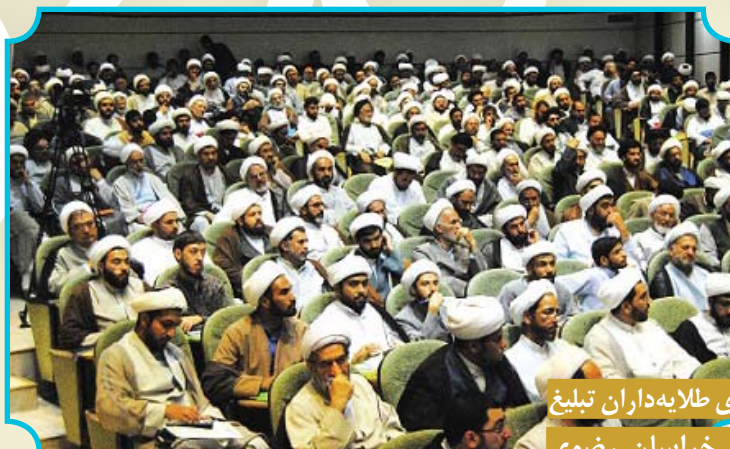
همایش علمی و کاربردی طلابداران تبلیغ ویژه مبلغان استان خراسان رضوی برادران خواهران