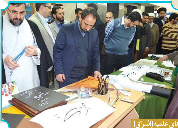
همایش علمی و نمایشگاه آثار ادبی و هنری حوزویان در هفته فرهنگی حوزه های علمیه (اشراق)