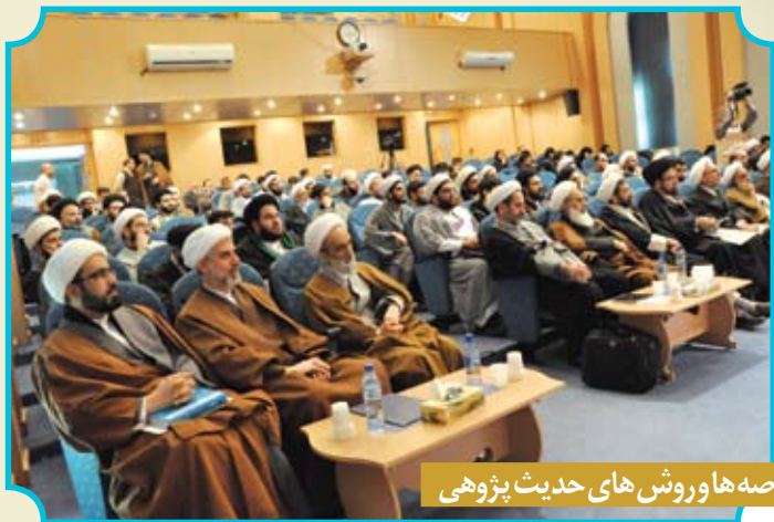
پنجمین همایش عرصه ها و روش های حدیث پژوهی