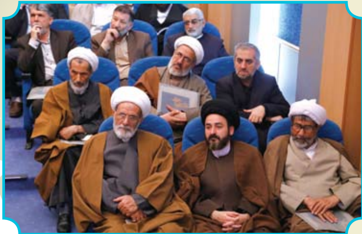
مراسم رونمایی از تفسیر شریف خلاصه البیان مرحوم آیت الله سید هاشم نجف آبادی با حضور مدیران عالی حوزه علمیه